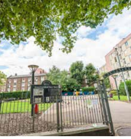
Hampstead Road-এর খোলা জায়গা