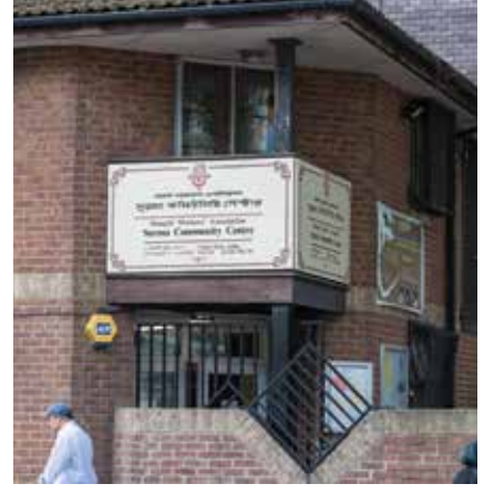
Robert Street-এর Surma Centre