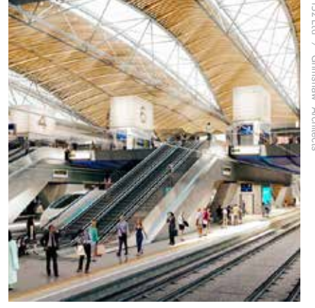
Euston-এ প্রস্তাবিত স্টেশন কনকোর্স

6 নভেম্বর 2015 তারিখ রাত 11:45 টায় এই মতামত গ্রহণ শেষ হবে।