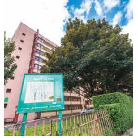
The Regent's Park Estate