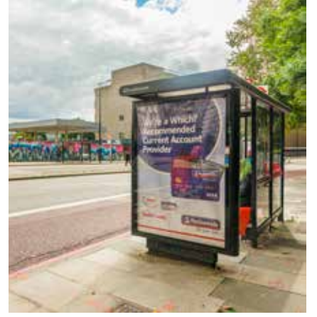
Hampstead Road-এর বাস স্টপেজ