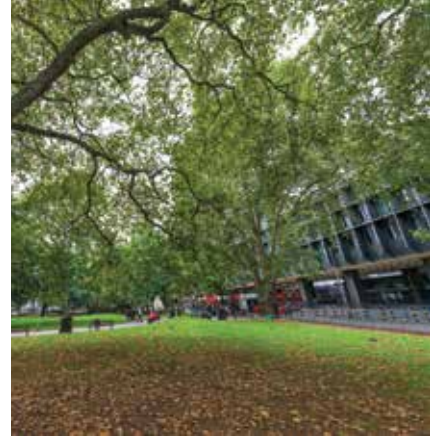
Euston Square Gardens

৬ নভেম্বর ২০১৫ তারিখ রাত ১১:৪৫ টায় এই মতামত গ্রহণ শেষ হবে।